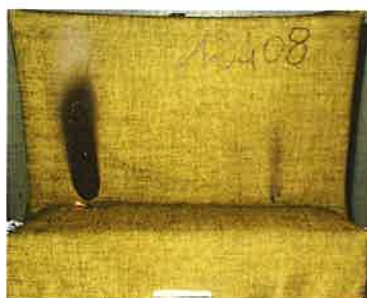
Il secondo innesco sulla provetta