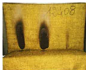
Il terzo innesco sulla provetta

NOTE: ATTENZIONE PROVA NON UTILIZZABILE AI FINI DELL'OMOLOGAZIONE