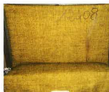
Il primo innesco sulla provetta