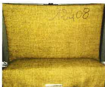
la provetta prima della prova