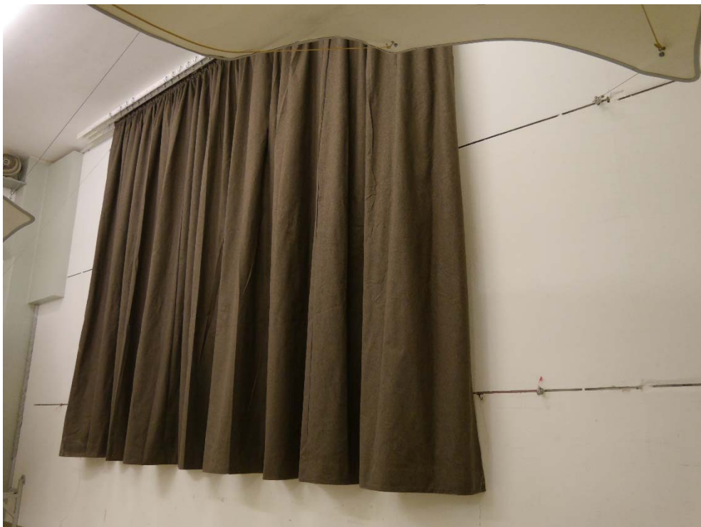
Abbildung B.2. Prüfobjekt im Hallraum: Schrägansicht.

\\s-muc-fs01\allefirmen\MI\Proj\076\M76176\M76176_48_PBE_1D.DOCX : 14.10.2020