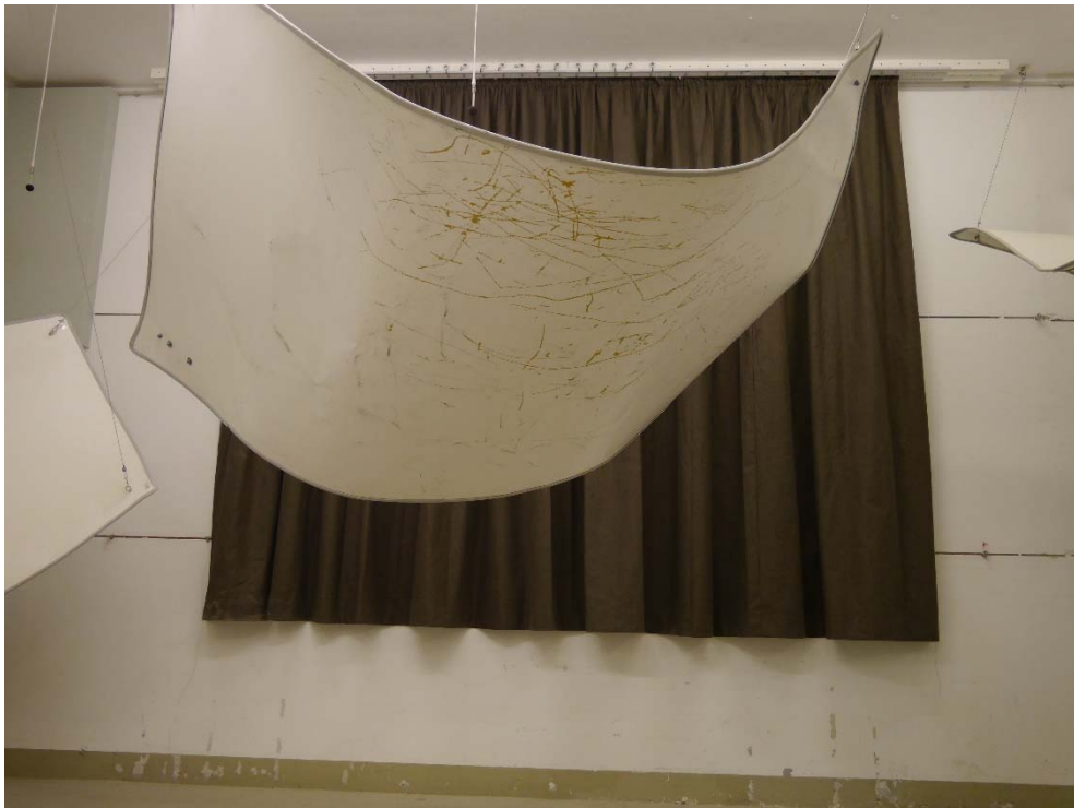
Abbildung B.1. Prüfobjekt im Hallraum: Frontalansicht.