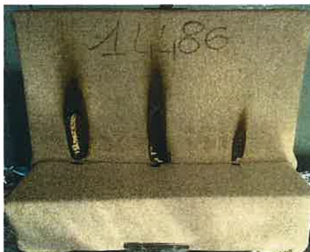
Il terzo innesco sulla provetta

NOTE: ATTENZIONE PROVA NON UTILIZZABILE AI FINI DELL'OMOLOGAZIONE