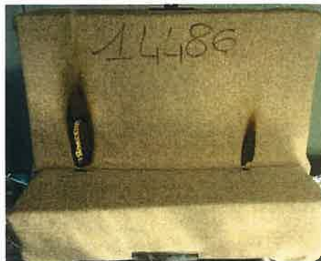
Il secondo innesco sulla provetta