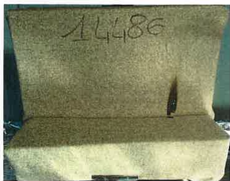
Il primo innesco sulla provetta