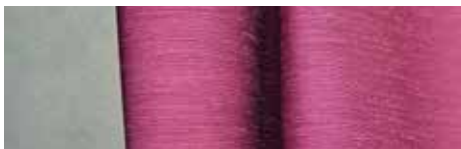
Enduction d'acrylate doux au revers